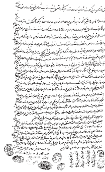
سواد وصیت‌نامه میرزامقیم مورخ صفر ۱۳۱۱